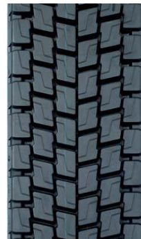
K 54 KDE2