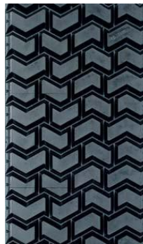
K 50 MK 50