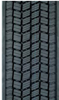
K 43 VDA4